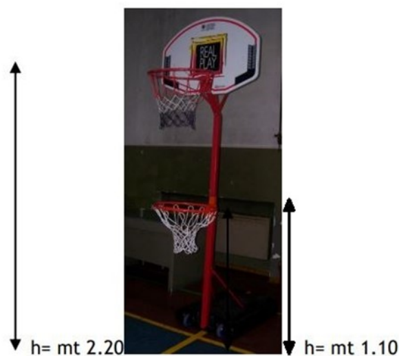
Figure 3 : Exemple de panier latéral